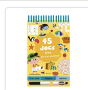
45 JOCS PER A LES VACANCES AA.VV.