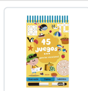
45 JUEGOS PARA LAS VACACIONES AA.VV.