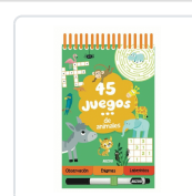
45 JUEGOS DE ANIMALES AA.VV.