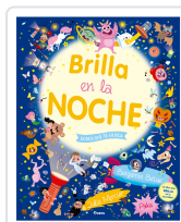
BUSCA QUE TE BUSCA. BRILLA EN LA NOCHE AAVV