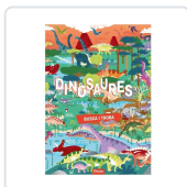
BUSCA I TROBA DINOSAURES AA.VV.