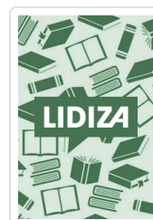
INTRODUCCION A LA MAGIA AMBER K