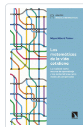
MATEMATICAS DE LA VIDA COTIDIANA ALBERTI PALMER, MIQUEL