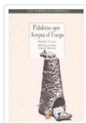
PALABRAS QUE ACEPTA EL FUEGO (XIII PREMIO POESIA) C.SALAMANCA CRESPO, RAMON