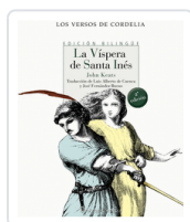
VISPERA DE SANTA INES KEATS, JOHN