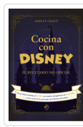
COCINA CON DISNEY CRAFT, ASHLEY