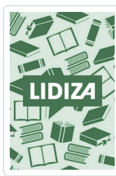
BOLSA TELA LA DEPENDIENTA