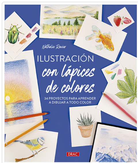
ILUSTRACIÓN CON LÁPICES DE COLORES