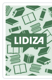
TRAMPAS DEL LENGUAJE Y OTROS ENIGMAS LINGÜÍSTICOS BENÍTEZ BURRACO, ANTONIO