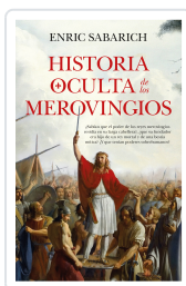
Historia oculta de los merovingios Enric Sabarich