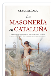
La masonería en Cataluña César Alcalá