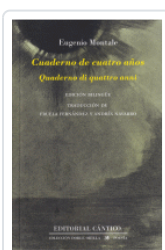
CUADERNO DE CUATRO AÑOS (ESP/ITA) MONTALE, EUGENIO