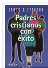
PADRES CRISTIANOS CON EXITO JAMES B. STENSON