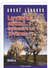
MORAL SEXUAL EXPLICADA A LOS JOVENES ANDRE LEONARD