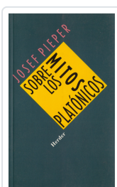
SOBRE LOS MITOS PLATONICOS PIEPER, JOSEF