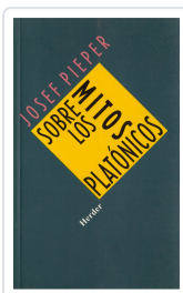
SOBRE LOS MITOS PLATONICOS PIEPER, JOSEF