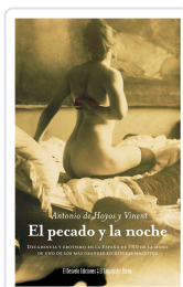
PECADO Y LA NOCHE Antonio de Hoyos Vinent