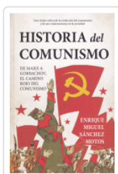
HISTORIA DEL COMUNISMO SANCHEZ MOTOS, ENRIQUE MIGUEL