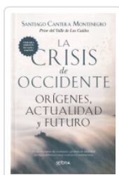
CRISIS DE OCCIDENTE 3/EA CANTERA MONTENEGRO, SANTIAGO