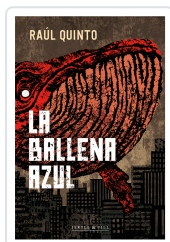
LA BALLENA AZUL QUINTO, RAUL