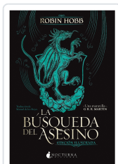
La búsqueda del asesino Hobb, Robin