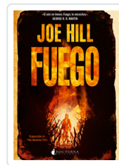
FUEGO HILL, JOE