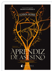
Aprendiz de asesino Hobb, Robin