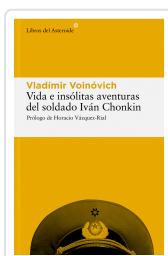
VIDA E INSÓLITAS AVENTURAS DEL SOLDADO IVÁN CHONKIN VOINOVICH, VLADIMIR