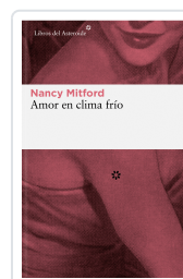
AMOR EN CLIMA FRÍO MITFORD, NANCY