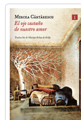
OJO CASTAÑO DE NUESTRO AMOR CĂRTĂRESCU, MIRCEA