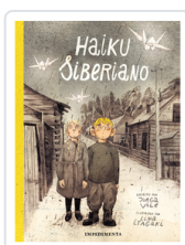
HAIKU SIBERIANO ITAGAKI / VILE