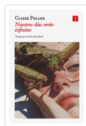
NUESTROS DÍAS SERÁN INFINITOS FULLER, CLAIRE