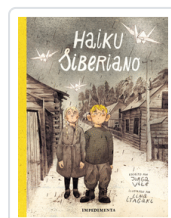
HAIKU SIBERIANO ITAGAKI / VILE