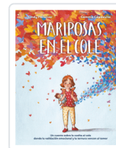
MARIPOSAS EN EL COLE PEÑALVER, CINDY