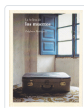
BELLEZA DE LOS MUERTOS RODRIGUEZ, ILDEFONSO