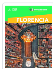
FLORENCIA MICHELIN GUIA VERDE AA.VV.