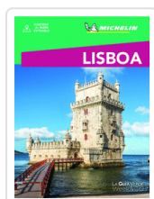
LISBOA MICHELIN GUIA VERDE AA.VV.