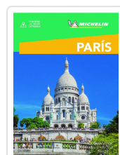
PARIS GUIA VERDE WEEK DYAN, FLORENCE