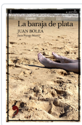
BARAJA DE PLATA BOLEA, JUAN