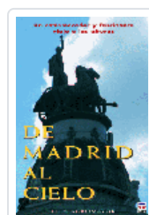
DE MADRID AL CIELO AGROMAYOR