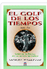
GOLF DE LOS TIEMPOS (NOVELA) MAZZUCCO