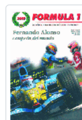
FORMULA 1 (2005) FERNANDO ALONSO:CAMPEON DEL MUNDO D'ALESSIO ; STIRANO ; VAN ELDIK ; MARSH