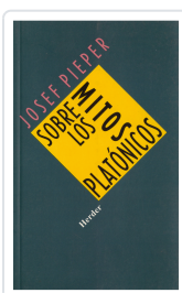
SOBRE LOS MITOS PLATONICOS PIEPER, JOSEF