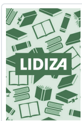
PC AL LIMITE BERTELSONS/RASCH