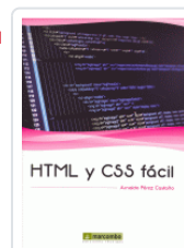
HTML Y CSS FACIL PEREZ CASTAÑO, ARNALDO