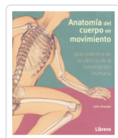
ANATOMIA DEL CUERPO EN MOVIMIENTO BREWER, JOHN