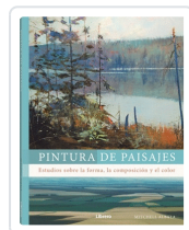
PINTURA DE PAISAJES ALBALA, MITCHELL