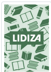
HISTORIA DE LA CAMARA FOTOGRAFICA GEORGE EASTMAN MUSEUM