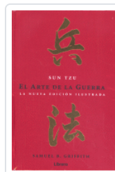
ARTE DE LA GUERRA N/E ILUSTRADA TZU, SUN / GRIFFITH