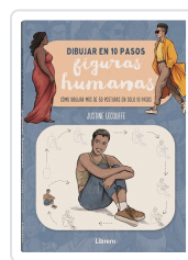
DIBUJAR FIGURAS HUMANAS EN 10 PASOS LECOUFFE, JUSTINE