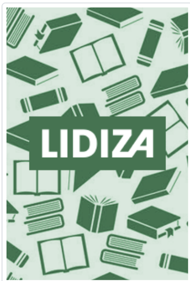
TABLA TIEMPOS VERBALES-INGLES (LAMINAS DIDACTICAS)