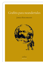
GRAFITIS PARA NEANDERTALES REICHMANN, JORGE