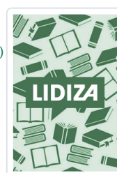
SISTEMA DIGESTIVO.NUTRIENTES (LAMINAS DIDACTICAS)