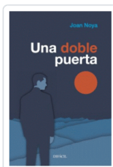
UNA DOBLE PUERTA NOYA, JOAN