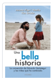
UNA BELLA HISTORIA FIGA I VAELLO ; DRAKE