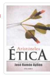
ÉTICA (ARISTOTELES) AYLLÓN, JOSÉ RAMÓN