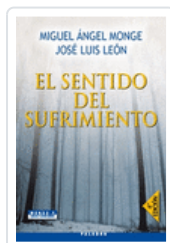
SENTIDO DEL SUFRIMIENTO 4/E MONGE ; LEÓN