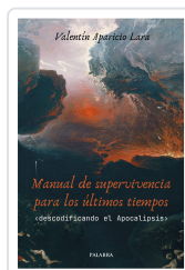
Manual de supervivencia para los últimos tiempos Aparicio Lara, Valentín