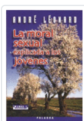
MORAL SEXUAL EXPLICADA A LOS JOVENES ANDRE LEONARD