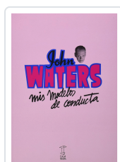
MIS MODELOS DE CONDUCTA WATERS, JOHN