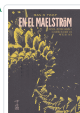
EN EL MAELSTRÖM MÚSICA, IMPROVISACIÓN Y SUEÑO DE LIBERTAD TOOP, DAVID