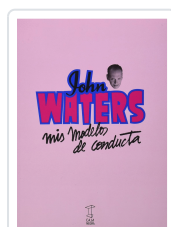
MIS MODELOS DE CONDUCTA WATERS, JOHN