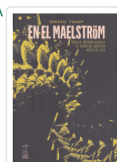
EN EL MAELSTROM MUSICA, IMPROVISACION Y SUEÑO DE LIBERTAD TOOP, DAVID