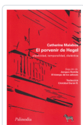
PORVENIR DE HEGEL MALABOU, CATHERINE