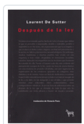
DESPUES DE LA LEY DE SUTTER, LAURENT