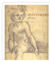
PONTORMO DIBUJOS AA.VV.