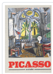
PICASSO EN EL TALLER AA.VV.