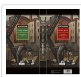
POEMAS VASCOS / EUSKAL POEMAK + ESTUCHE DE OTERO, BLAS