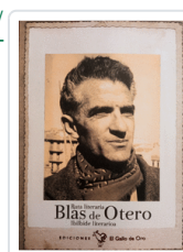
RUTA LITERARIA BLAS DE OTERO DE OTERO, BLAS