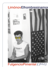
HOMBRE SIN AMOR LIMONOV, EDUARD