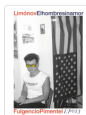
HOMBRE SIN AMOR LIMONOV, EDUARD