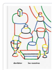
LOS NUESTROS DOVLATOV, SERGUEI