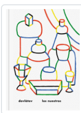
LOS NUESTROS DOVLATOV, SERGUEI