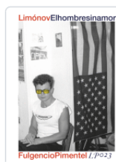
HOMBRE SIN AMOR LIMONOV, EDUARD