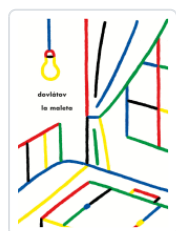
MALETA DOVLATOV, SERGUEI