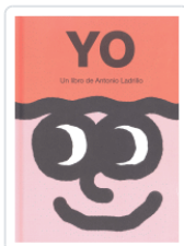
YO UN LIBRO DE ANTONIO LADRILLO LADRILLO, ANTONIO