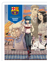
SIEMPRE BARCA TORRENTS / DALMASES