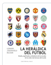
HERÁLDICA DEL FÚTBOL JAGERSKIOLD NILSSON, LEONARD