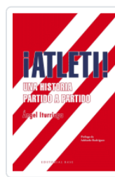
ATLETI UNA HISTORIA PARTIDO A PARTIDO ITURRIAGA, ANGEL