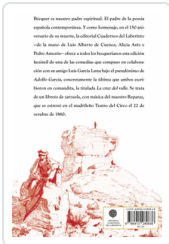
CRUZ DEL VALLE BECQUER/ DE CUENCA