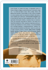
CARLOS GARDEL EN ESPAÑA GUERRERO CABRERA, MANUEL