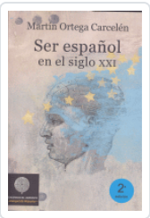
SER ESPAÑOL EN EL SIGLO XXI 2/E ORTEGA CARCELÉN, MARTÍN