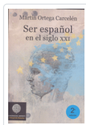
SER ESPAÑOL EN EL SIGLO XXI 2/E ORTEGA CARCELÉN, MARTIN