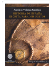
HISTORIA DE ESPAÑA ESCRITA PARA MIS NIETOS VELASCO GARRIDO, ANTONIO