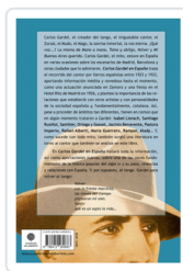
CARLOS GARDEL EN ESPAÑA GUERRERO CABRERA, MANUEL