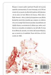
CRUZ DEL VALLE BECQUER DE CUENCA